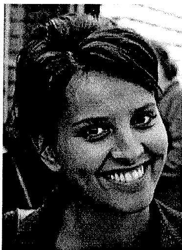
Najat Vallaud-Belkacem, secrétaire nationale en charge des questions de société

Les tests ADN, la brevetabilité du vivant, la gestation pour autrui (GPA), les cellules souches, la filiation... Ces questions touchent et toucheront de plus en plus notre vie, parfois le sens même que nous voulons lui donner.